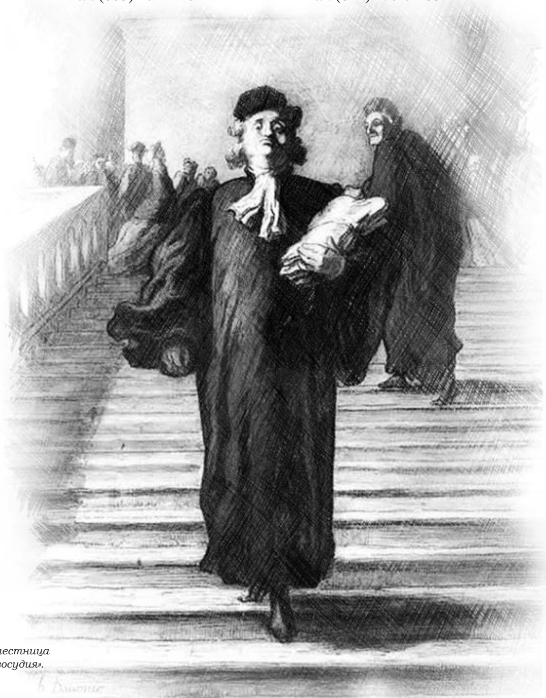
О. Домье. «Парадная лестница дворца правосудия». Ок. 1850 г.

ул. Екатерининская, 59 Тел. (342) 270-01-68